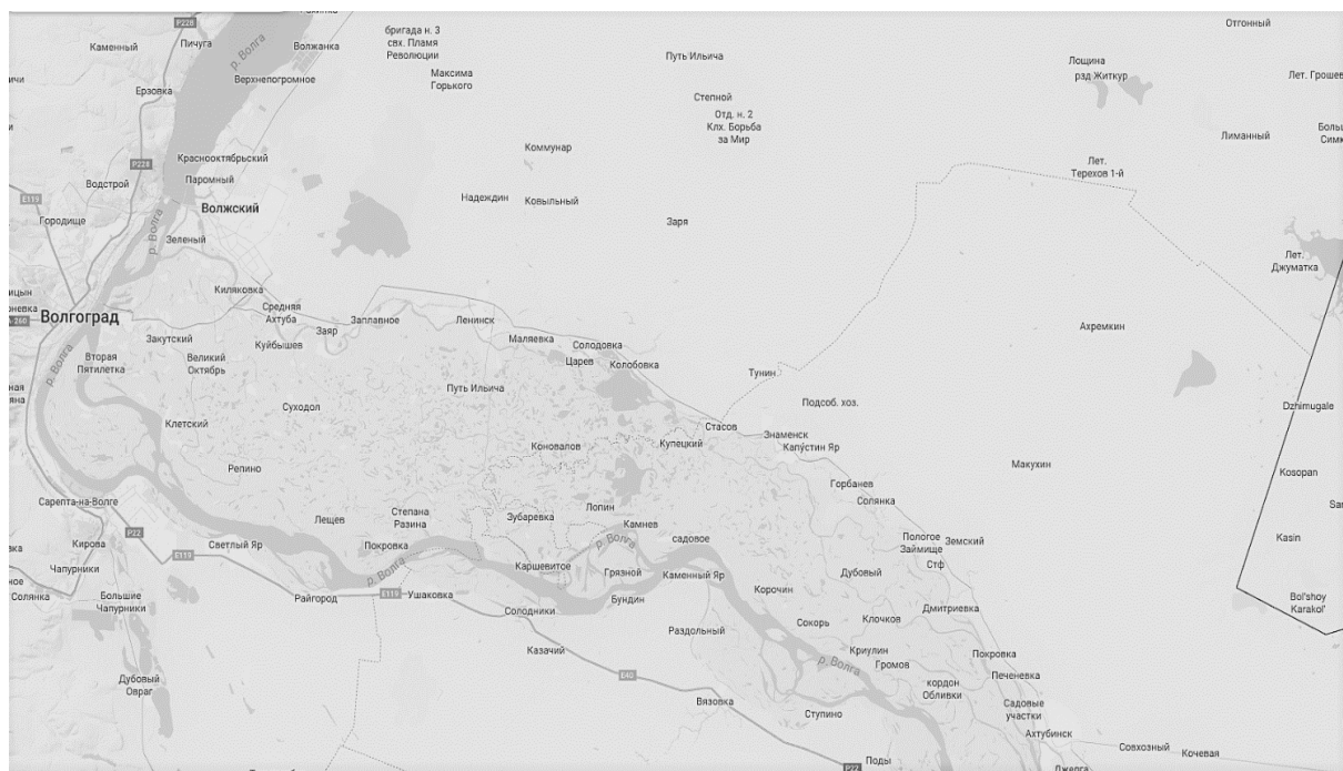
Рис. 3. Расположение водных объектов Волго-Ахтубинской поймы на территории Волгоградской области

Основное заполнение водных объектов Волго-Ахтубинской поймы происходит в период весеннего половодья через рукав Ахтуба, на протяжении 130–150 км от его истока. Уровень горизонта воды рукава Ахтуба на данном отрезке выше отметок воды в реке Волга. В меженный период превышение уровня воды в Ахтубе над уровнем Волги может составлять от 0,5 до 3,0 м, что является определяющим фактором для формирования гидрографической сети Волго-Ахтубинской поймы.