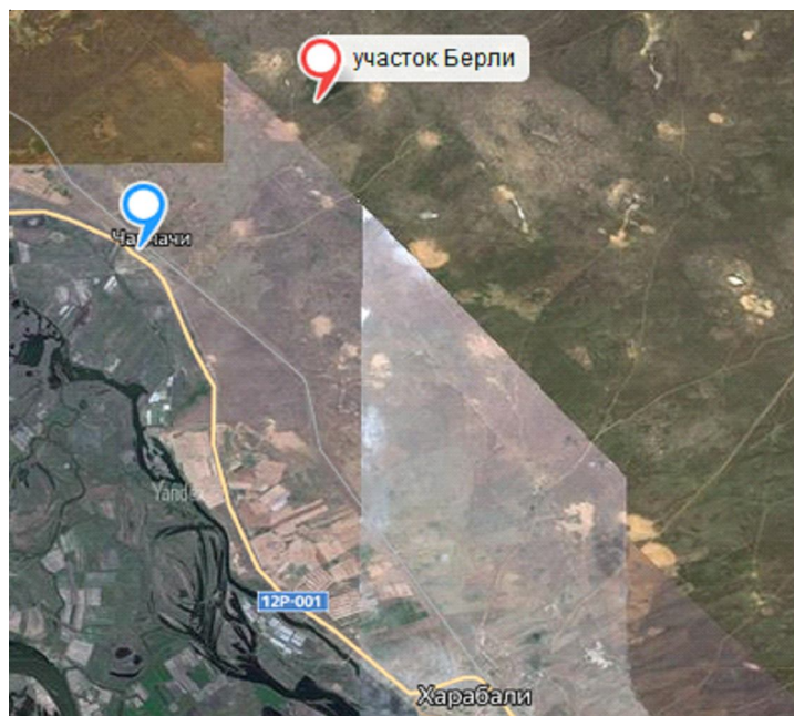
Рис. 1. Объект исследований, участок Берли, Харабалинский район, Астраханская область (47°33' с.ш.; 47°16' в.д.)

нентные посевы (контроль) сконструированы на лизиметрах ФНЦ агроэкологии РАН, на 2-почвенных субстратах, черноземовидном и светло-каштановом супесчаном. Размер лизиметра 1,75 × 3,6 м [9].