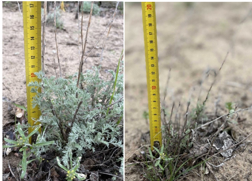
Рис. 2. Надземная фитомасса Kochia prostrata (L.) Schrad., лизиметр со светло-каштановым супесчаным субстратом, пастбище «лето – осень», г. Волгоград, 15.07.2020 г.