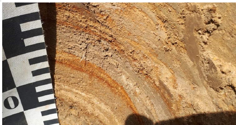
Рис. 2. Железистые новообразования в виде псевдофибр в разрезе Е3

Разрез Е3 заложен в 50 м от разреза Е2. Почвообразующие породы представлены аллювиальными ожеженными карбонатными отложениями. Разрез на типовом уровне идентичен разрезу Е2, однако на подтиповом уровне заметно отличается, поскольку процессы, протекающие в нем, существенно изменили морфологические характеристики почвенных горизонтов. На дневной поверхности расположен светлогумусовый горизонт, полностью пронизанный корнями травянистых растений, а также содержащий с поверхности антропогенные включения в виде строительного и бытового мусора. Расположенные ниже слои аллювиальных отложений отличаются от слоев в разрезе Е2 более высокой степенью увлажнения, а также наличием железистых новообразований в виде псевдофибр диаметром 0,1–0,2 см (рис. 2). На глубине 75–82 см фикс-